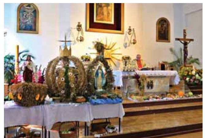
Wieńce dożynkowe, od lewej – Akcji Katolickiej, Koła Gospodyń Wiejskich i mieszkańców Czekaia.