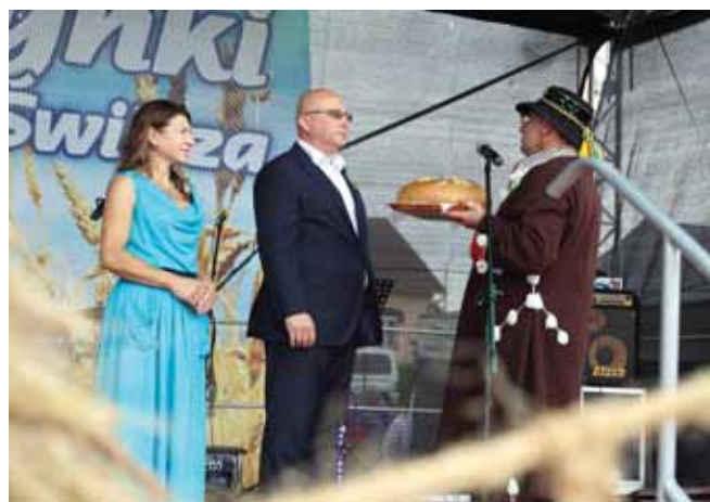
Chleb – symbol obfitości otrzymuje Wójt z Małżonką.

W swoim wystąpieniu Wójt Gminy powiedział: – Dziękuję bardzo za ten wymowny dar. Zboże i z niego wypieczony chleb jest wynikiem współdziałania Stwórcy i człowieka. Jest to również wyobrażenie Waszego trudu Drodzy Rolnicy. Potwierdził, że tegoroczne zbiory nie są rekordowe, ale za wszystko trzeba dziękować Stwórcy i ludziom.