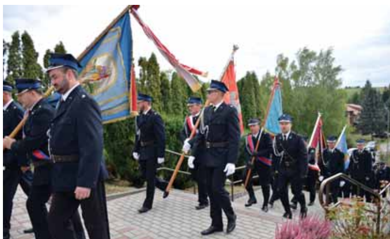
W drodze do kościoła parafialnego.