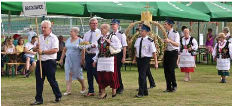
Delegacja wieńcowa sołectwa Bratkowice podczas tegorocznych Dożynek Gminnych w Trzcianie.

– długoletniej przewodniczącej KGW, jako wyraz szczególnego podziękowania i uznania za zasługi w działalności społecznej m.in. na rzecz Koła, środowiska, parafii i gminy. Natomiast delegacja wieńcowa Akcji Katolickiej i Caritas, godnie reprezentowała bratkowicką wspólnotę parafialną podczas tegorocznych Dożynek Diecezjalnych w katedrze rzeszowskiej w niedzielę 28 sierpnia 2022 r.