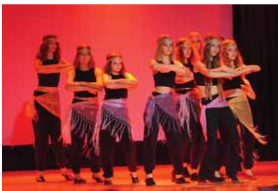
Grupa starsza Rudna Wielka