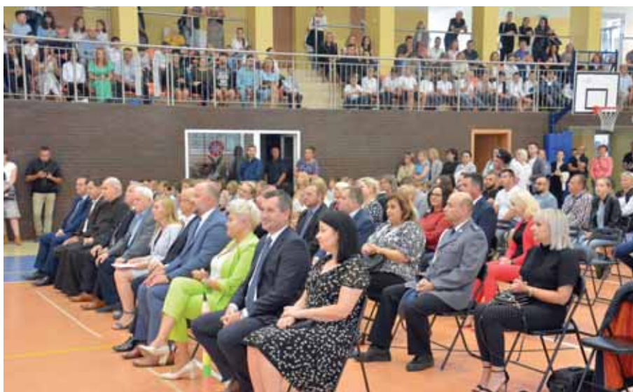
W sali widowiskowo-sportowej Szkoły Podstawowej w Świlczy.

Scenariusz słowno-muzyczny uroczystości nawiązywał do obchodów 83. rocznicy wybuchu II wojny światowej, czasu odpoczynku, letniej kanikuly. W czasie uroczystości powitaliśmy również w gromadzie uczniowskiej najmłodszych-pierwszoklasistów w liczbie 32 uczniów, którzy złożyli uroczyste ślubowanie. Aktu pasowa-