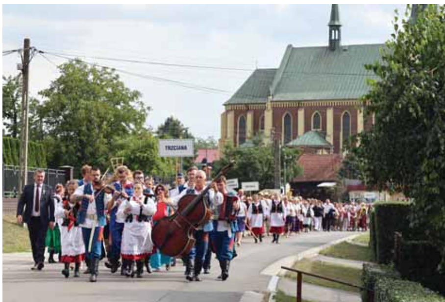
W drodze na stadion sportowy.