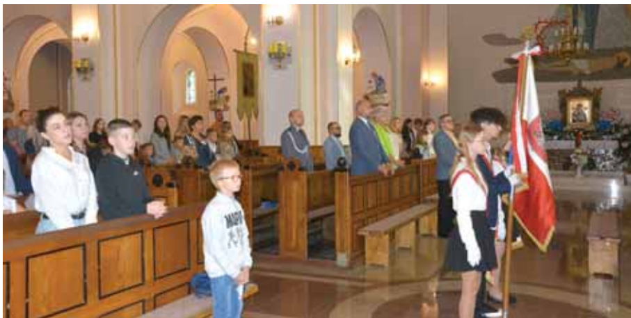
W kościele parafialnym w Świlczy.

Mówiąc o planach pracy na rok szkolny 2022/2023 zapewnił, że nie zabraknie działań dotyczących obchodów świąt rocznicowych oraz realizacji treści związanych z szeroko pojętym bezpieczeństwem, w tym bezpieczeństwem w sieci oraz działaniami w ramach tematyki prozdrowotnej, ochrony klimatu, ekologii.