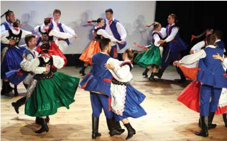
Grupa reprezentacyjna, tańce rzeszowskie.

Po powitaniach i podziękowaniach rozpoczęła się bogata część artystyczna