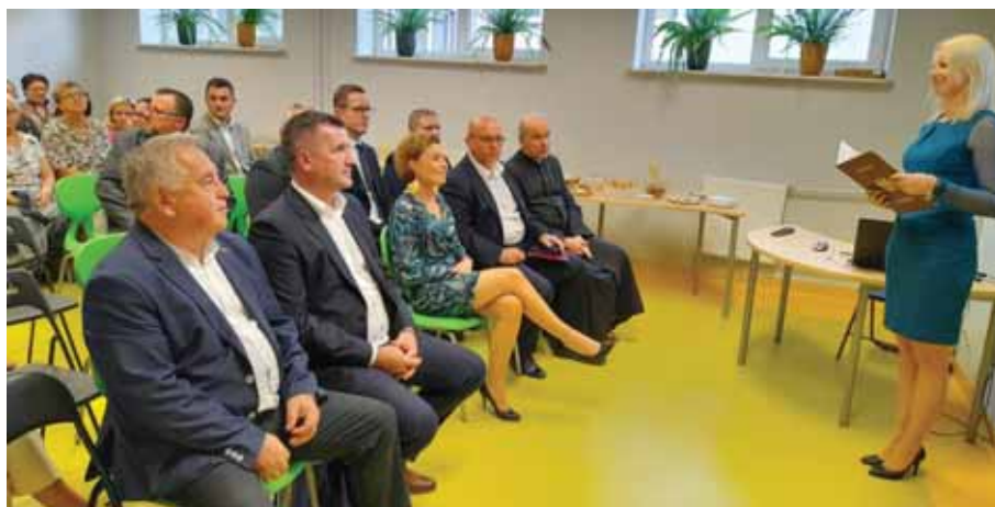
Z książki płynie odwaga, książka życiu pomaga.

Przepyszny poczęstunek przygotowany przez pracowników GBP w Świlczy z/s w Trzcionce oraz wspaniały tort, a następnie rozmowy kulturalowe przebiegały bardzo szybko i w serdecznej atmosferze.