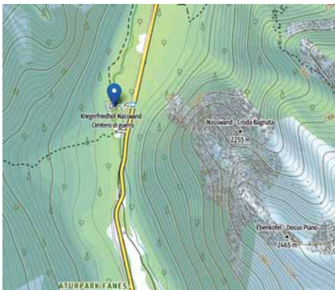
Lokalizacja cmentarza Nasswand nazywany również Cmentarzem Sorgenti lub Croda Bagnata, albo Cmentarzem Monte Piana w dolinie Ladro.