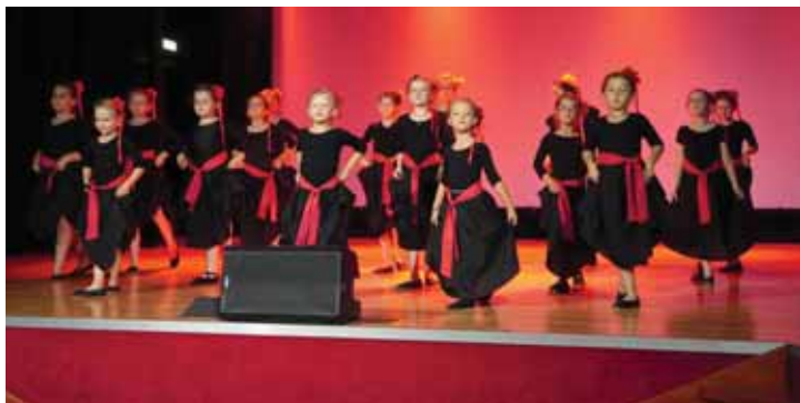
Grupa młodsza Rudna Wielka