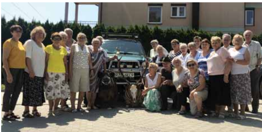
Spotkanie w Gminnym Klubie Seniora z przedstawicielami Koła Łowieckiego „Pogorzalka”.