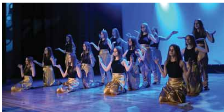
Grupa najstarsza Bratkowice