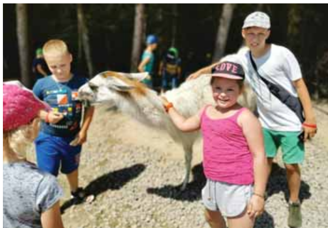
Atrakcjom nie było końca...