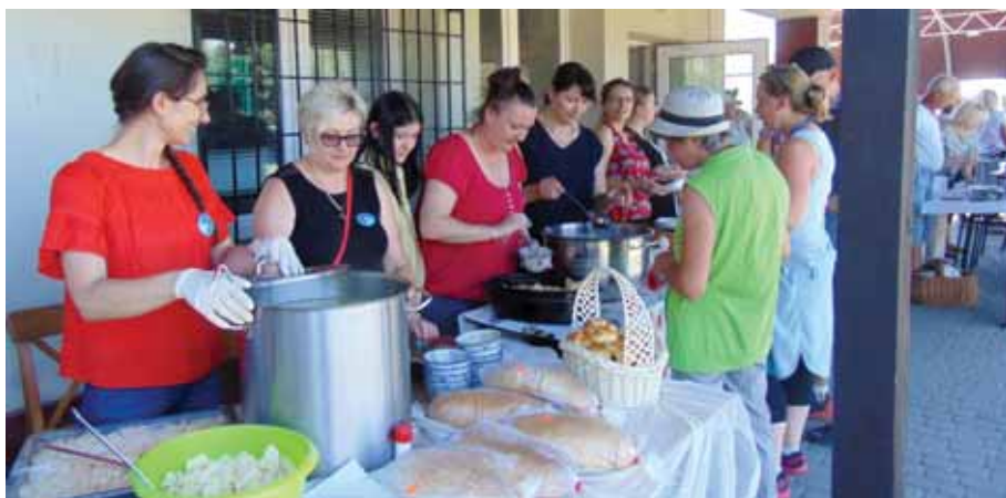
Gospodynie z Bratkowic przygotowały różnorodne dania dla pielgrzymów.

py wyruszyły w dalszą drogę na Jasną Górę, by tu przed tronem Matki Bożej Królowej Polski, dziękować Jej za całoroczną opiekę, otrzymane liczne łaski i prosić o dalsze dla najbliższej rodziny w różnych intencjach. Opuszczając bratkowicką parafię pątnicy, dziękowali mieszkańcom za wyjątkowo gościnne przyjęcie i poczęstunek, zapewniając jednocześnie o modlitewnej pamięci. Po południu pątnicy po przejściu przez miejscowość Czarna Sędziszowska, dotarli do Kamionki. Tu zakończył się pierwszy etap ponad