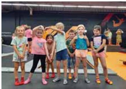
W parku trampolin.

Po upalnych dniach, które nie opuszczały nas w pierwszym tygodniu udaliśmy się po odrobinę chłodu do najstarszej w Polsce Kopalni Soli w Bochni, która po prawie ośmiu wiekach wydobywania kruszcu, wygląda dziś jak podziemne miasto. Niesamowitą atrakcją dla dzieci był zjazd do kopalni i podróż podziemną kolejką. Zwiedzanie kopalni miało charakter podróży w czasie. Pokazane zostały