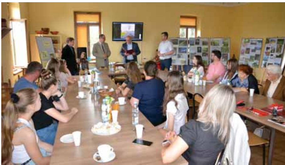
Sala narad RDTL.

Komisja konkursowa stwierdziła, że na konkurs nadesłano 309 fotografii, wykonanych przez 85 autorów. Spośród nadesłanych zdjęć do ścisłej czołówki Komisja zakwalifikowała 32 fotografie, a następnie z nich wybrała laureatów konkursu.