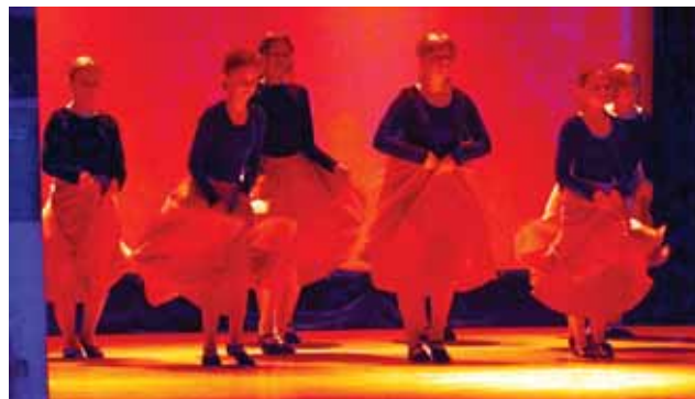
Grupa starsza Bratkowice