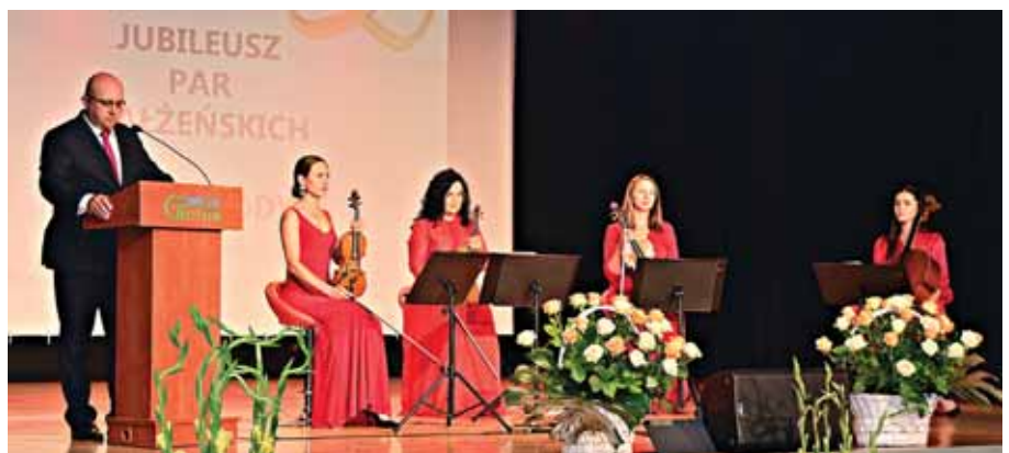
Rzeszowski kwartet smyczkowy „Simple Quartet”.

Gratulacje szczerze i najserdeczniejsze należą się wszystkim Jubilatom – to całe pół wieku!