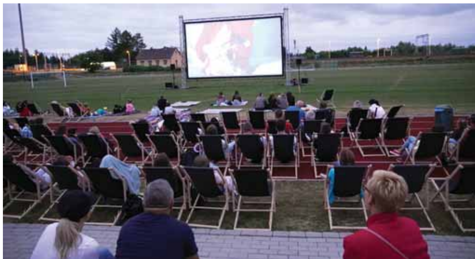
Kino plenerowe w Trzcianie...

Za rok powrócimy z letnim kinem w kolejnych miejscowościach naszej gminy.