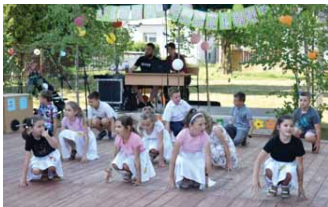
Układ taneczny w wykonaniu uczniów.