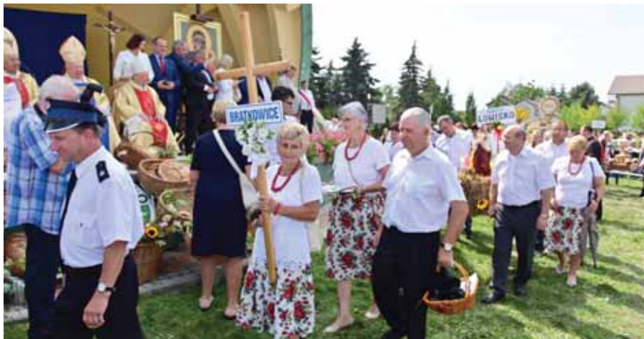
Delegacja wieńcowa z Bratkowic podczas Dożynek Diecezjalnych.