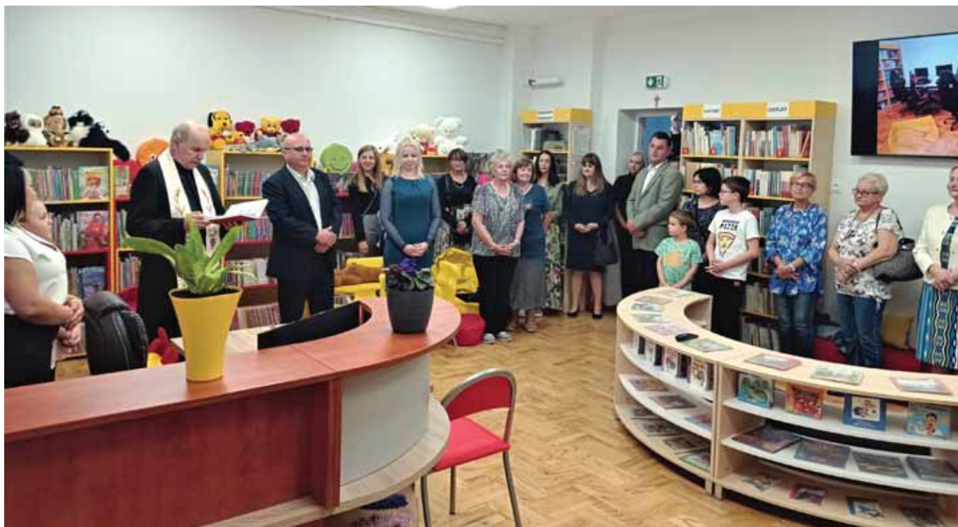
Chcemy książek jak słońce...!