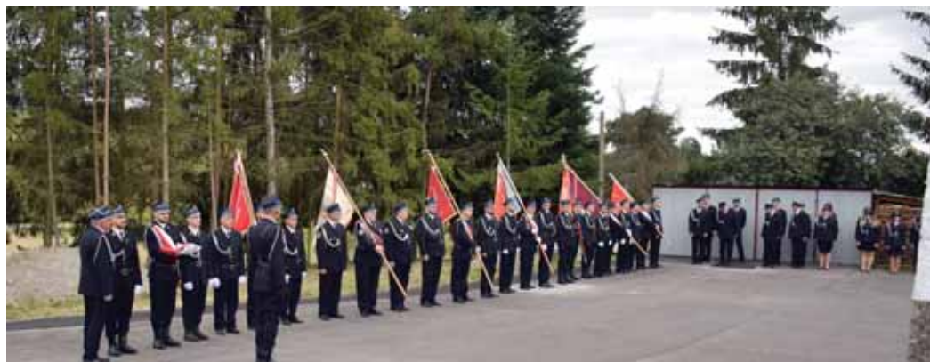
Na placu przed remizą strażacką.

Jubileusz jest okazją do gratulacji, podziękowań, wyróżnień, szczególnie dla tych druhów i druhen, którzy swoją pracą społeczną i zaangażowaniem przyczyniają się do rozwoju swojej Jednostki i lokalnego środowiska. Uchwał