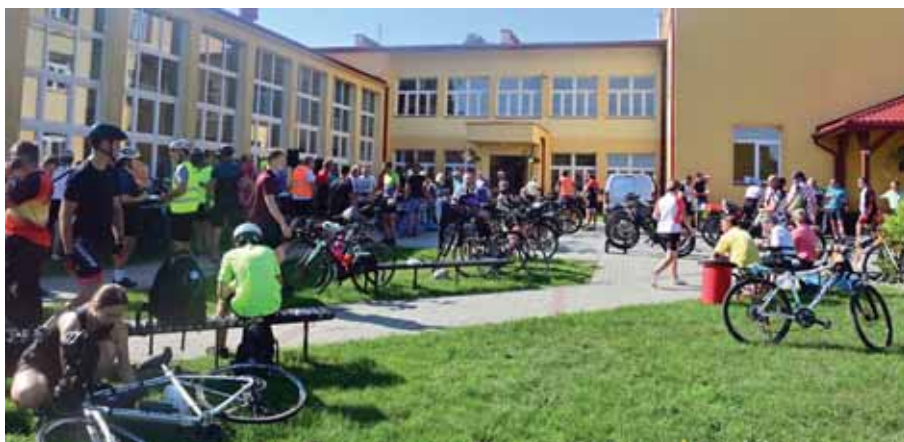
Odpoczynek wszystkich grup pątników rowerzystów.