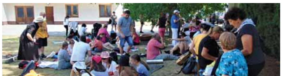
Odpoczynek na placu przed plebanią.