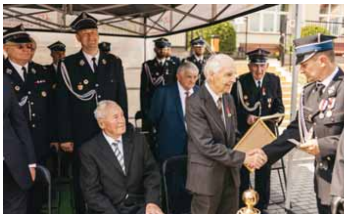
Najlepiej jest... wśród swoich...