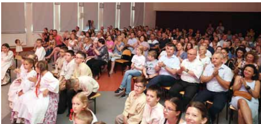
Licznie zgromadzona publiczność.

układ – efektowne tańce i przyśpiewki przeworskie. Najstarsi wychowankowie zaprezentowali tańce Lachów Sądeckich i tańce Rzeszowskie wraz z przyśpiewkami.