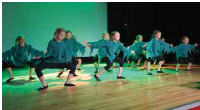
Grupa średnia Bratkowice