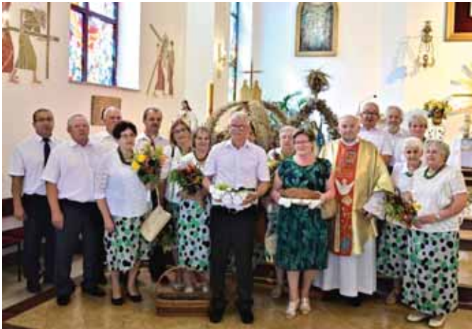
Delegacja wieńcowa mieszkańców Czekaia i Grupa wieńcowa Akcji Katolickiej z ks. proboszczem.