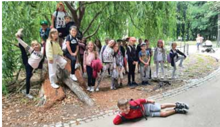
Wycieczka do Rzeszowa.