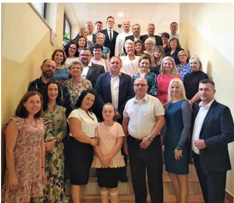
Na wejściowych schodach...

Biblioteka publiczna – tak się nazywa, bo pracuje na rzecz społeczności lokalnej niezależnie od wieku użytkownika. Biblioteki publiczne służą zaspokajaniu potrzeb oświatowych, kulturalnych i informacyjnych