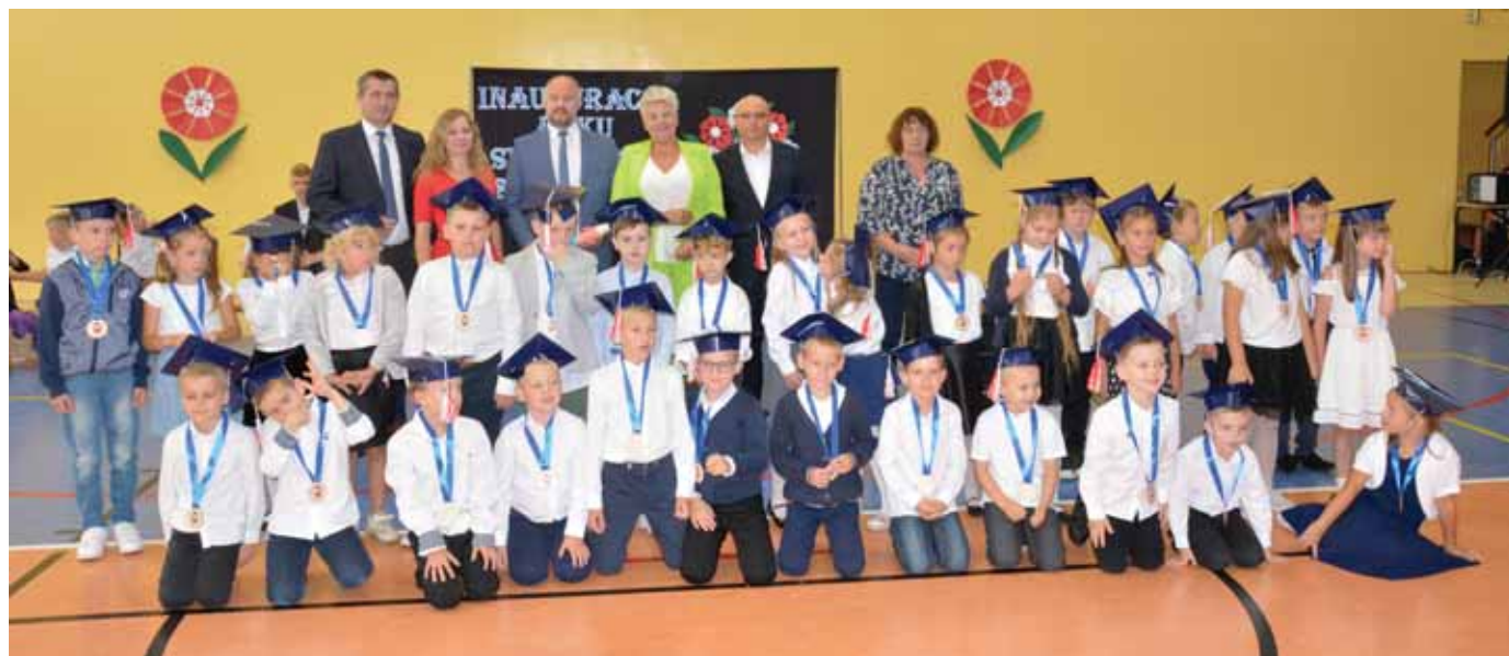
Niech nowy rok szkolny będzie radosny, pracowity, bezpieczny i z sukcesami.

Po uroczystościach uczniowie udali się do klas na spotkania z wychowawcami.