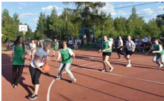
Mecz koszykówki rodzice kontra uczniowie.