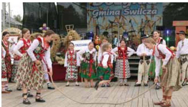
Zespół Ślebodni i Zawaternik