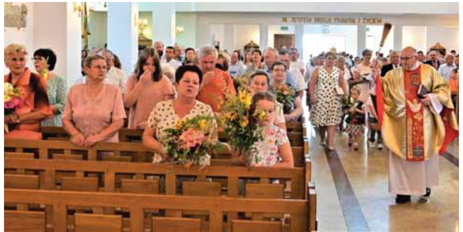
Poświęcenie bukietów z kwiatów i ziół.

W tym dniu rolnicy – mieszkańcy Bratkowic, przybyli do miejscowego kościoła parafialnego pw. św. Jana Chrzciciela, by podziękować Bogu