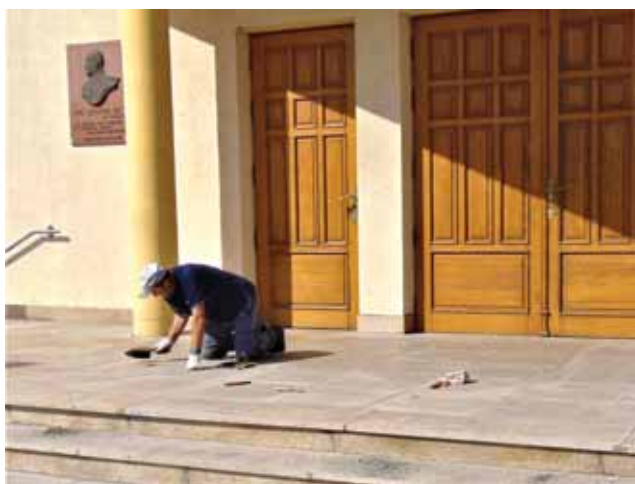
Renowacja schodów przed wejściem głównym do kościoła.