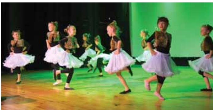
Grupa najmłodsza Bratkowice