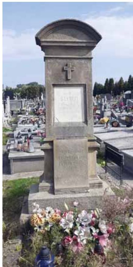
Pomnik nagrobny Władysława Szameyta na cmentarzu parafialnym w Przybyszówce – stan 2022 r.