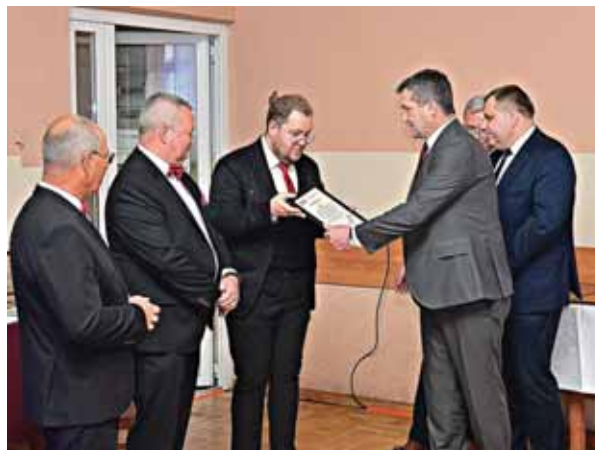
Gratulacje od Wójta Gminy Świlcza.

„ Tobie Mały Panie ” oraz modlitwa „ Otche Nash ”. Chór wraz z sympatykami regularnie bierze udział w zgrupowaniach, na których warsztaty chóralne połączone są z wypoczynkiem i rekreacją. W ostatnim czasie udało się dwukrotnie zorganizować warsztaty na Podhalu, w Poroninie i Gro-