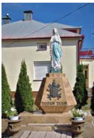
Kapliczka z figurką M.B. z Lourdes na placu przed plebanią.

impregnującym, schody przed wejściem głównym do kościoła oraz od strony południowej i północnej, zostały gruntownie odnowione oraz zabezpieczone przed szkodliwym działaniem warunków atmosferycznych. Ponadto na placu przed plebanią przeprowadzono remont i konserwację cokołu kapliczki z figurą Matki Bożej z Lourdes. Wszystkie prace wykonał J. Szyjka – mieszkaniec Bratkowic.