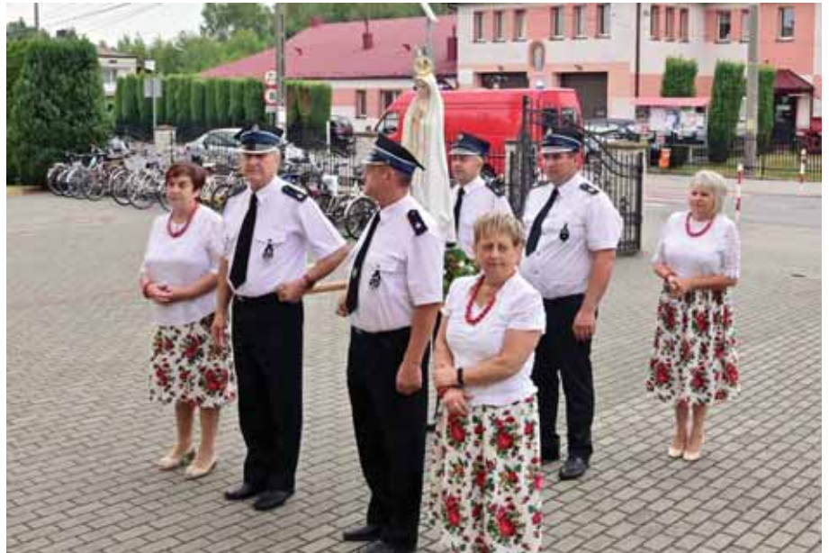
Delegacja bratkowickiej parafii z figurką, przed wprowadzeniem do kościoła.

W trakcie całodziennej adoracji, w której uczestniczyli licznie parafianie o godz. 15.00, odmówiono Koronkę do Miłosierdzia Bożego. Następnie godz. 17.00 odprawione zostało nabożeństwo Fatimskie i Różaniec, a po nim uroczysta Msza św. do Matki Bożej. W dalszej części adoracji od godz. 19.00, uczestniczyli w niej m.in. Akcja Katolicka, Zespół „Caritas” i Stowarzyszenie Przyjaciół Wyższego Seminarium Duchownego, a od godz. 20.00 młodzież z KSM i Oaza. Na zakończenie adoracji o godz. 21.00 odbył się uroczysty Apel Jasnogórski.