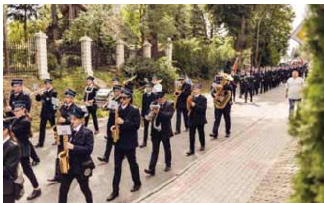
Na czele orkiestra dęta – strażacka.

Uchwałą prezydium Zarządu Gminnego ZOSP RP w Świlczy Ozna-