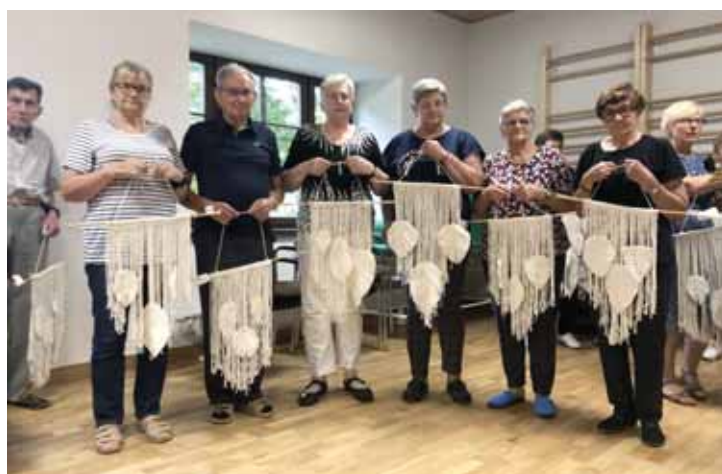
Warsztaty makramy w Gminnym Klubie Seniora w Trzcinie.