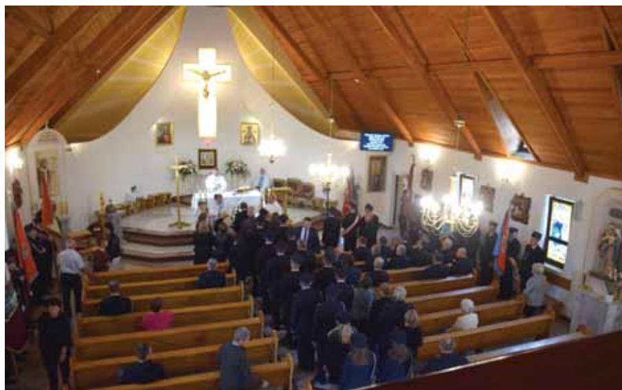
Część religijno-patriotyczna uroczystości jubileuszowej.

ściowy referat z uwzględnieniem najważniejszych epizodów z chlubnej 110-letniej historii miejscowej OSP.