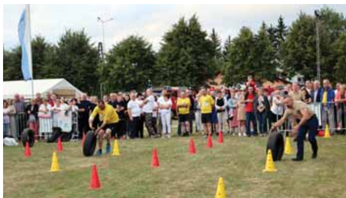
W Mrowli gwarno i wesoło.