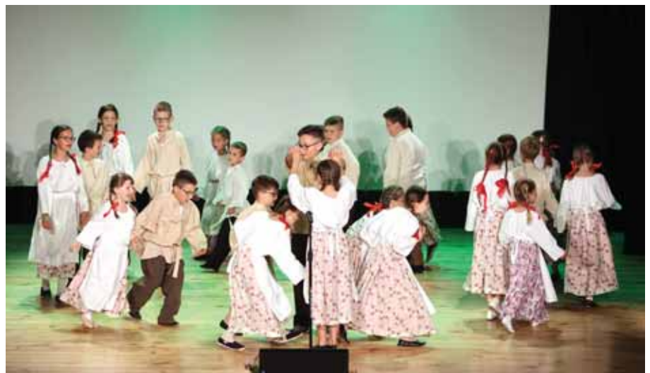
Grupa dziecięca młodszą, taniec lasowianek.

Sala widowiskowa i 2 balkony podczas koncertu wypełnione były po brzegi widzami, wśród których dużą grupę stanowili członkowie rodzin występujących tancerzy czy chórzystów z całej gminy. To dobrze! Imprezę zrealizowano ze środków będących w dyspozycji GCKSiR.