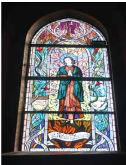
Witraż z wizerunkiem bł. Natalii Tułasiewicz w poznańskim kościele św. Wojciecha.

(Na podstawie art. medialnych, inf. wł.)