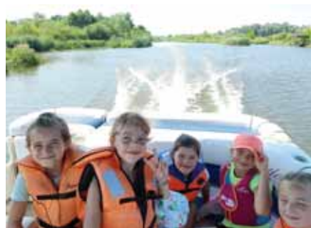
Rejs katamaranem po Wisłoku.

Ostatni dzień półkolonii spędziliśmy w Rzeszowie. Najważniejszym punktem programu była wizyta w kinie i projekcja filmu „Minionki: Wejście Gru”. Nudy w kinie nie było – dużo wątków, wiele postaci, same atrakcje!