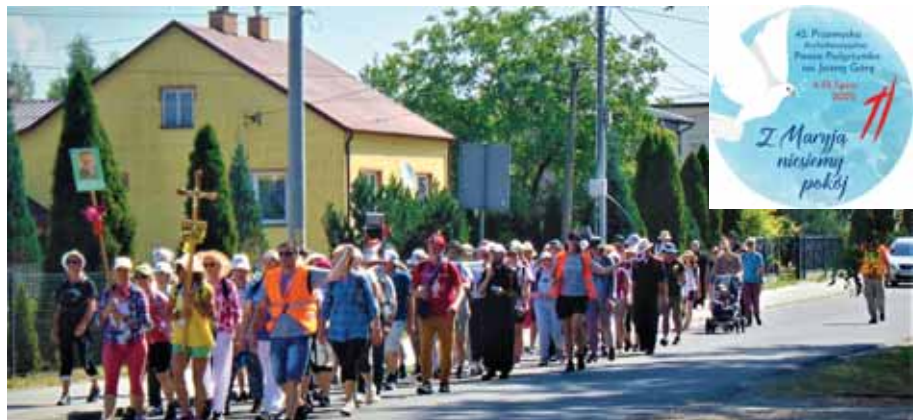
Pielgrzymi dotarli do centrum Bratkowic.

dynie z zachodniej strony bratkowickiej parafii (Czekaj, Klepak), za co należy się im szczególnie serdeczne podziękowanie. Po około godzinnym odpoczynku, każda z grup wyruszyła w dalszą drogę. Śpiewem i modlitwą dziękowali mieszkańcom Bratkowic za serdeczne i gościnne przyjęcie. Pielgrzymi dotarli na Jasną Górę 15 lipca, pokonując ponad 300 kilometrów w upale i deszczu. Pątnicy w swoich grupach przeszli do Kaplicy Cudownego Obrazu, by pokłonić się Matce Bożej Częstochowskiej. Swoje pielgrzymowanie zakończyli udziałem we Mszy św. w Bazylice Jasnogórskiej.