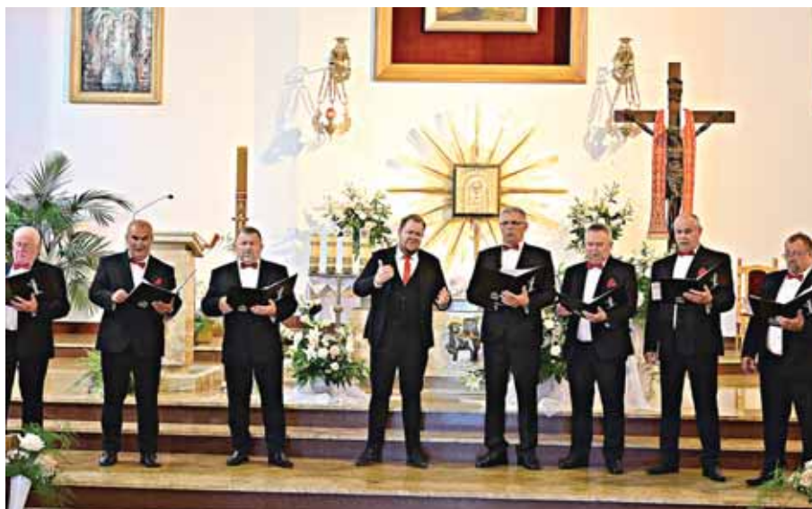
Thapelo w wykonaniu chóru i dyrygenta.