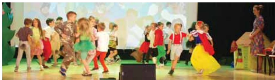
Wesoła polka w wykonaniu zerówczaków.

ter lokalny. W 1924 r. święto wprowadził do kalendarza prezydent John Calvin Coolidge Jr., zaś 42 lata później Lyndon Johnson podpisał prezydencką proklamację uznając trzecią niedzielę czerwca Dniem Ojca. Prezydent Nixon oficjalnie aktem prawnym ustanowił Dzień Ojca w 1972 roku.