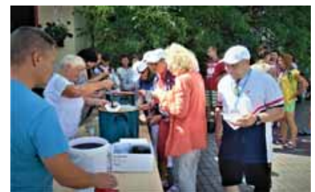
Pielgrzymom smakowały potrawy przygotowane przez bratkowickie gospodynie.