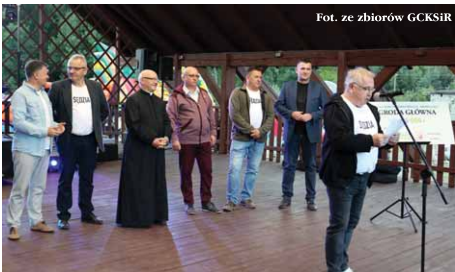
Fot. ze zbiorów GCKSiR

Środowisko gminy i każdego sołectwa wie, widzi i docenia wkład organizacyjny wszystkich twórców tej i innych imprez. Niech świat wie, że Gmina Świlcza sukcesywnie kroczy do przodu na tyle, na ile pozwalają mu uwarunkowania ekonomiczno-historyczne i inne. W procesach tych tkwią wciąż ci sami, często niedoceniani ludzie, oddani pracy społecznej na rzecz innych. Bez tych, których trudno wciąż wymieniać, nic nie mogłoby się odbyć. Oni ustawicznie służą tej społeczności. Dziękujemy!