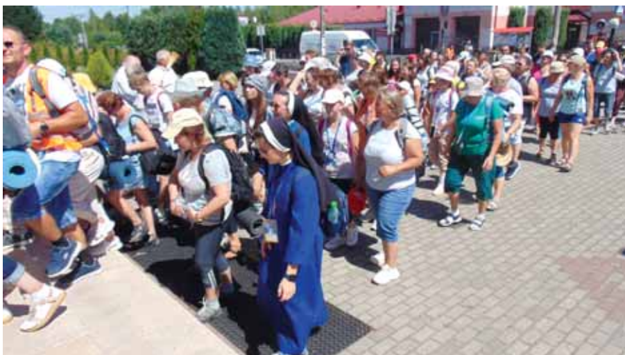
Pielgrzymi udają się do kościoła.

wspólnie w intencji pokoju na świecie i zakończenia wojny w Ukrainie.