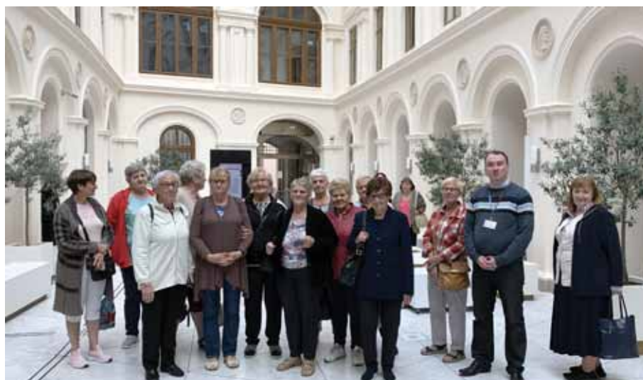
Wyjazd integracyjny do Krakowa uczestników Gminnego Klubu Seniora.

Cenimy bliskość biblioteki, ponieważ czytanie jest „jak chleb powszedni, jak picie wody u źródła, oranie