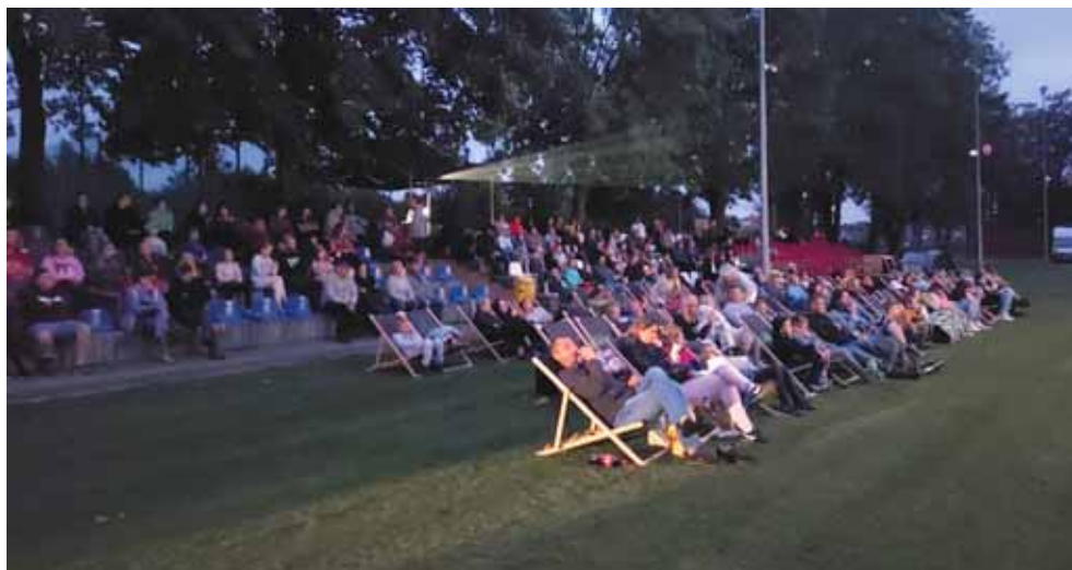
■ i w Świlczy.