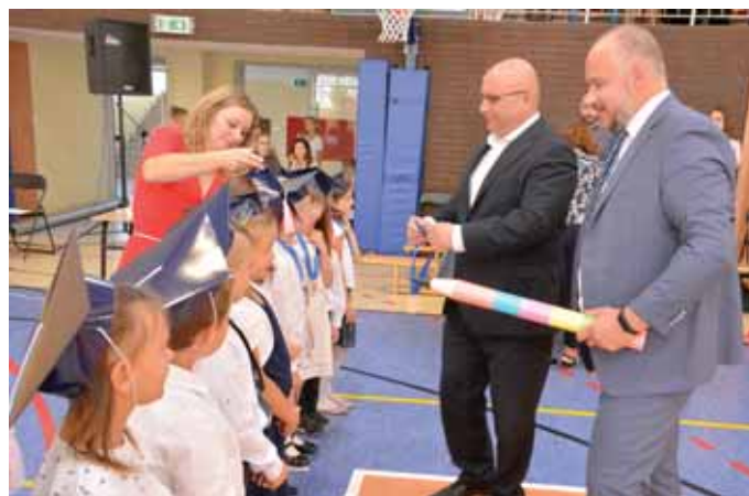
Pasowanie na ucznia.

– Jak w każdej dobrej opowieści najważniejsze jest pierwsze zdanie i dobry początek. Zatem do dzieła, Młodzi Autorzy! – takimi słowami Kurator Oświaty zachęciła do pracy, na-