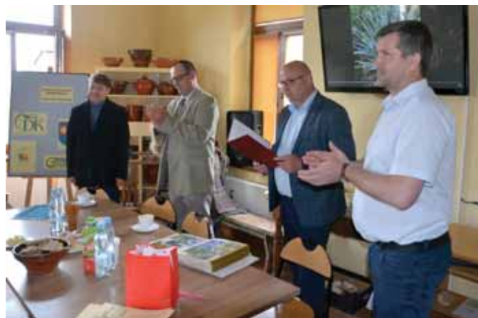
Sprawozdanie Jury konkursowego.