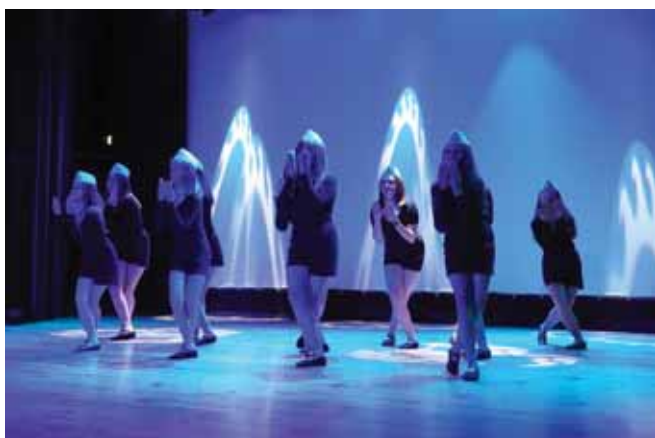
Grupa starsza Bratkowice

Na chwilę opuściliśmy Europę i udaliśmy się do upalnej Afryki. Zatrzymaliśmy się w Tanzanii, gdzie grupy z Bratkowic zabrały nas na safari. Najmłodsza grupa w kocich przebraniach porwała publiczność przy muzyce „The Lion sleeps tonight”, a na-