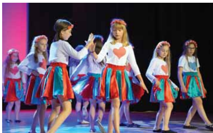
Grupa starsza Świlcza