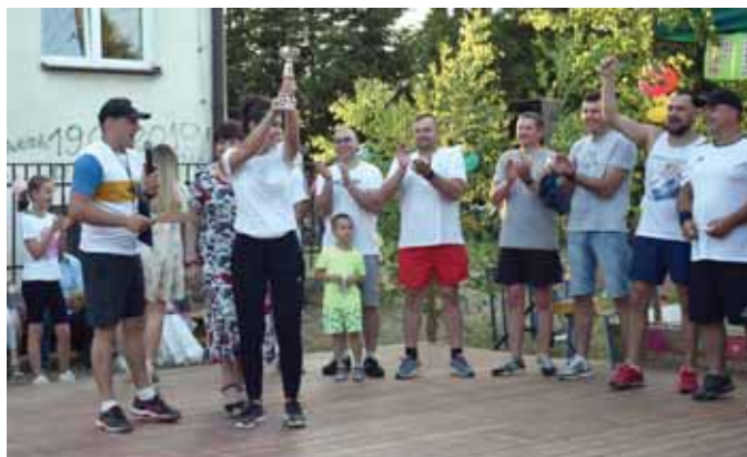
Puchar dla zwycięskiej drużyny rodziców.