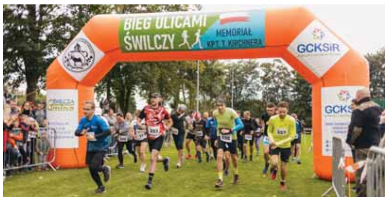
Start V Biegu Ulicami Świlczy na 5 kilometrów.