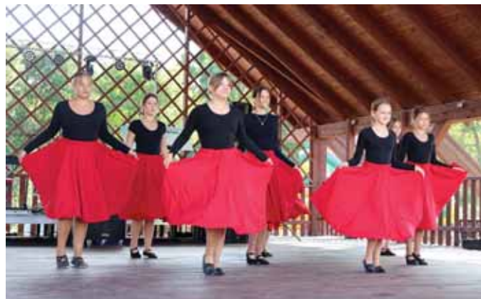
Tańce i pokazy.