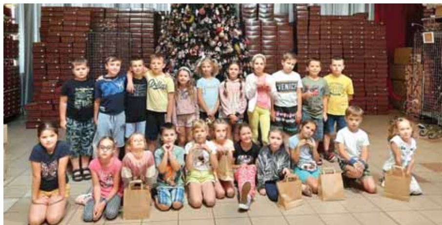
W Muzeum Bombek Choinkowych w Nowej Dębie.

Kolejny dzień turnusu stał pod znakiem rozwoju kulturalnego. Wtedy też odwiedziliśmy Muzeum Bombki Choinkowej w Nowej Dębie. Pod opieką przewodnika dzieci oglądały choinki z różnych części świata i różnych epok. Wielkim przeżyciem była możliwość uczestnictwa w warsztatach samodzielnego ozdabiania bombek.