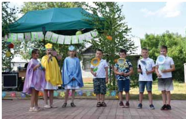
Program artystyczny w wykonaniu uczniów.