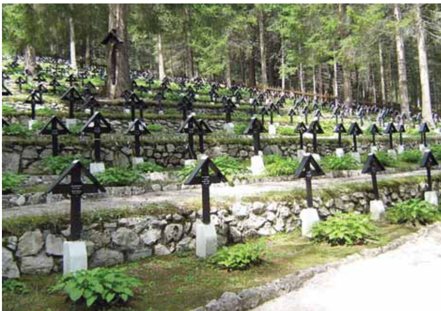
Austriacki cmentarz wojenny Nasswand koło Toblach, gdzie jest pochowany Antoni Łagowski.

Początkowo było tam pochowanych znacznie więcej, ale wcześniej,