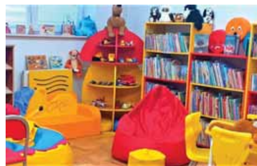
A to miej na pilnej pieczy, abyś czytał, ile tylko możesz... (S. Żeromski)

ogółu społeczeństwa oraz uczestniczą w upowszechnianiu wiedzy i kultury. Biblioteki publiczne gromadzą i udostępniają zbiory z literatury dla dzieci, młodzieży, dorosłych oraz literaturę popularnonaukową. Biblio-