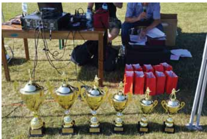
Pucharów ci u nas dostatek!