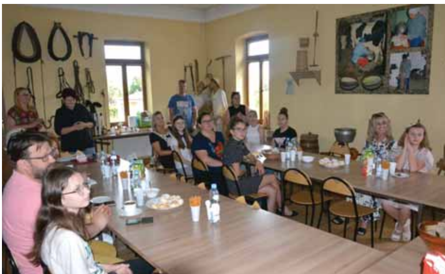
Uczestnicy słuchają wystąpień organizatorów.

wizualnie wszystkie inne elementy pejzażu – mówił Z. Lis, fotoreporter gminnej „Trzcionki”.