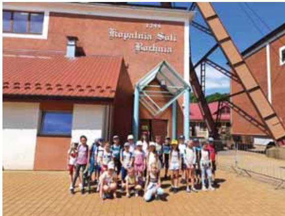
Wycieczka do kopalni soli w Bochni.

Serdecznie dziękujemy Wójtowi Gminy Świlcza za dofinansowanie półkolonii.