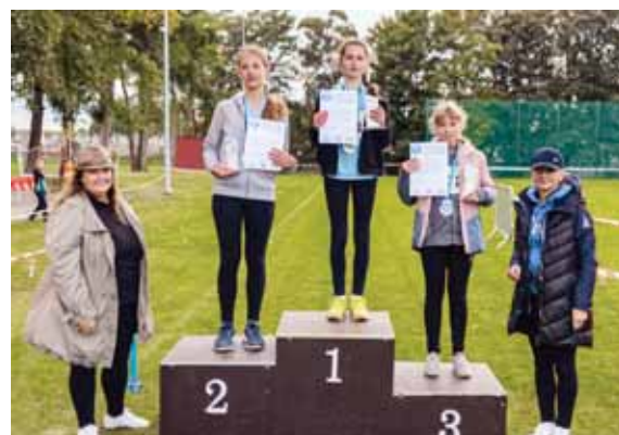
Dekoracja zwyciężek junierek.