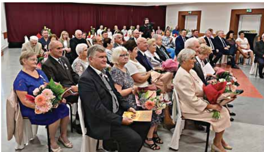
Jubilaci w sali widowiskowej GCKSiR w Trzcianie.