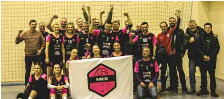
Klub Kibica wraz z zawodniczkami.

Poza sezonem rozgrywkowym Prezes wraz z Zarządem pracowali nad uzyskaniem dotacji z Ministerstwa Sportu i Turystyki, które jest organizatorem programu „Klub 2022”. Dotację tę Klub otrzymał. Zostanie ona w całości przeznaczona na działanie grupy młodzieżowej, której członkowie będą rozwijali siatkarski warsztat pod okiem doświadczonych trenerów. W zajęciach będzie mogła uczestniczyć młodzież z terenu całej gminy, jednak liczba miejsc będzie ograniczona. ■