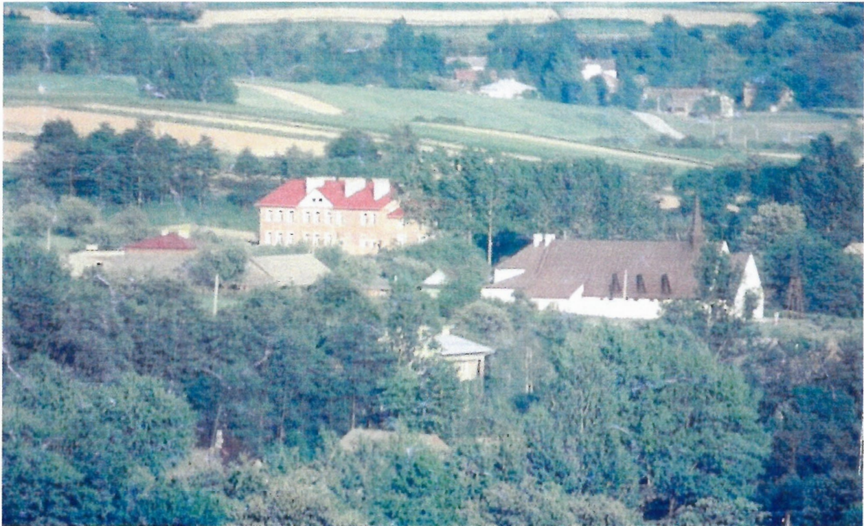
Błędowa Zgłobieńska – widok ogólny