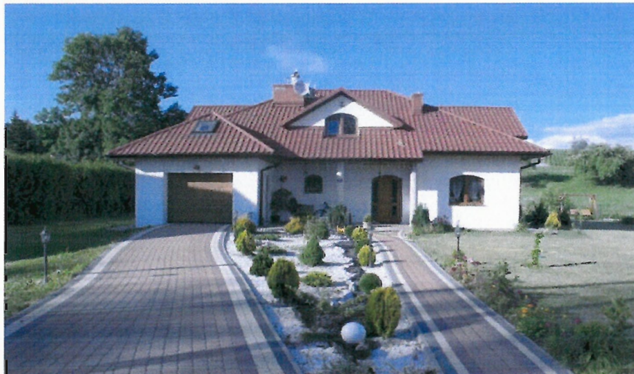
Nowoczesny dom jednorodzinny

Błędowa Zgł. posiada zwartą, charakterystyczną dla różnych okresów zabudowę i jest usytuowana wzdłuż kilku dróg powiatowych i gminnych. Odległość między dwoma najdalej położonymi zagrodami wynosi około 3 km. Liczba gospodarstw domowych we wsi wynosi obecnie 118. W strukturze Błędowej Zgł. od strony zachodniej wchodzi przysiółek „Lasek”. Oddalony on jest o dwa kilometry od centrum wsi. Mieszka tam obecnie 8 rodzin (od wielu lat) i tyleż samo „przybyszy”.