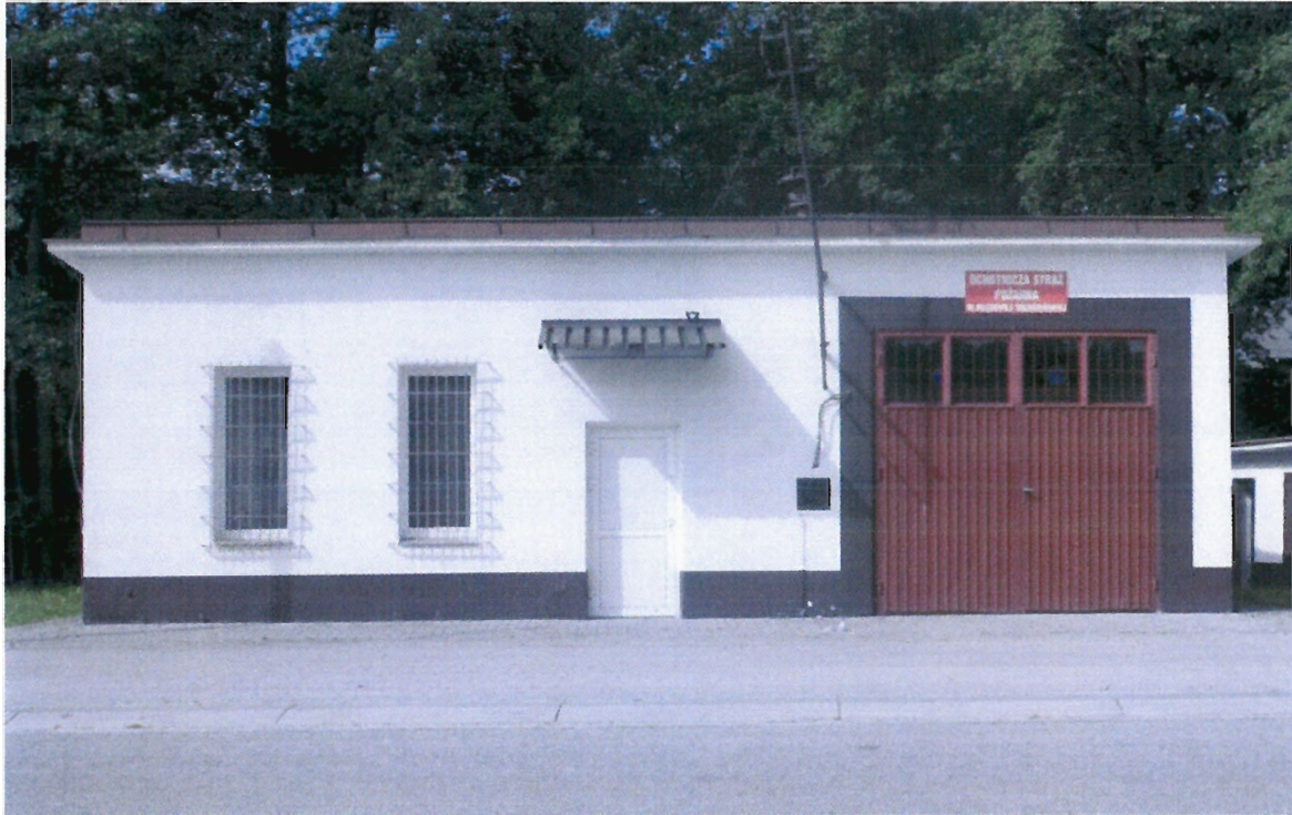
Budynek remizy Ochotniczej Straży Pożarnej

Zniszczona drewniana remiza zmusiła strażaków do budowy nowej. Dom Strażaka wraz z zapleczem wybudowano w latach 1968-70.