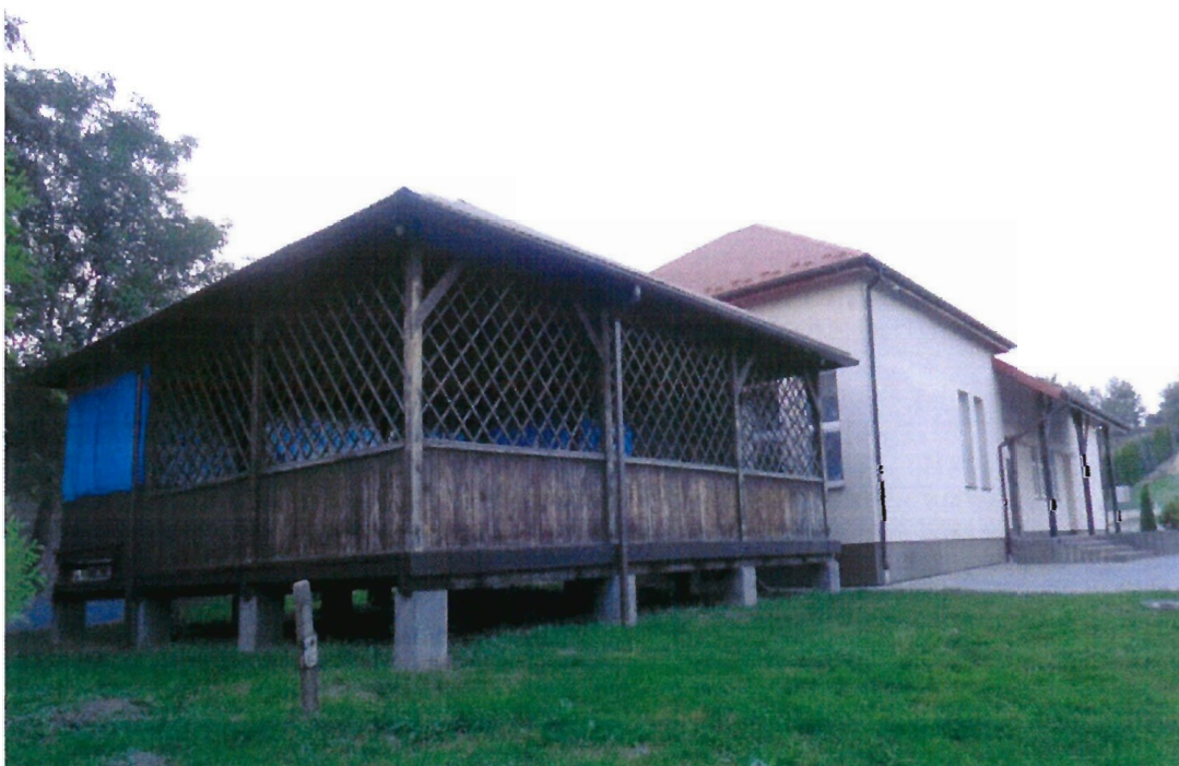
Dom Ludowy wraz z zadaszoną podłogą

W latach 1952-1954 wieś została zelektryfikowana na koszt mieszkańców. Istniejący do chwili obecnej system energetyczny jest w dobrym stanie technicznym, odpowiednio zmodernizowany, pokrywa aktualne potrzeby w zakresie zaopatrzenia w energię elektryczną, gwarantuje odpowiedni poziom zasilania odbiorców.