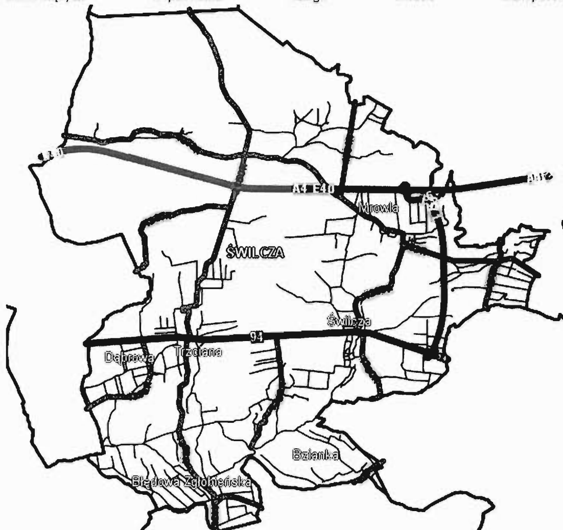
Rysunek 1. Błąd! Użyj karty Narzędzia główne, aby zastosować 0 do tekstu, który ma się tutaj pojawić. System drogowy gminy Świlcza

System drogowy na terenie gminy Świlcza opiera się drogach krajowych (11,6% dróg na terenie gminy Świlcza) drogach powiatowych (21,9% ogółu dróg) oraz drogach gminnych (66,5%) stanowiących dopełnienie całego układu transportowego.